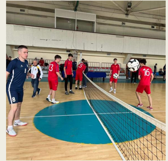
(b) Fotbal – Tenis